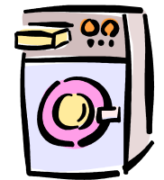
※コインランドリーは棟内