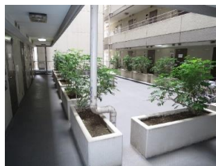
▲2Fオープンスペース