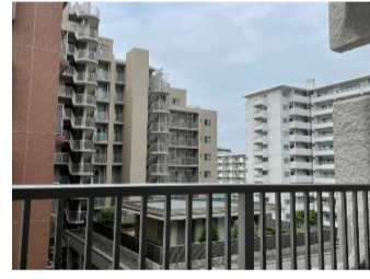
▲507号室バルコニーからの開放感ある眺望