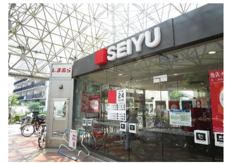
▲スーパー「西友」徒歩2分