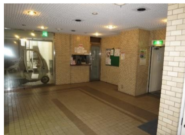
▲エントランスホール