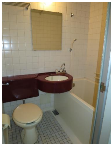
▲3点式ユニットバス