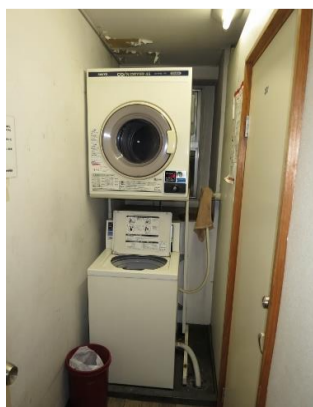
▲2Fのコインランドリー