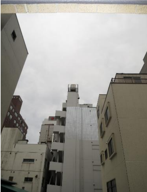
▲バルコニーからの眺望