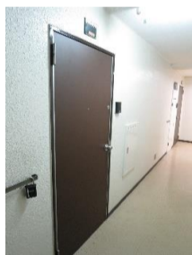
▲玄関扉 (外側) ▼玄関扉 (内側) (Wロック)