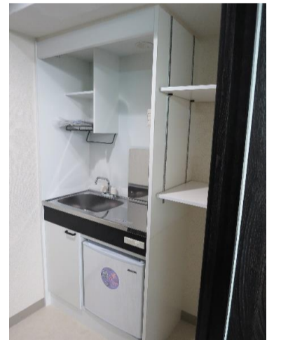
▲給湯コーナー (下部ミニ冷蔵庫)