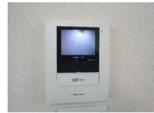
▲TVモニター付 インターフォン