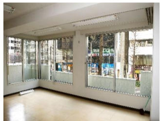
▲南側主開口は人形町通りに面します。