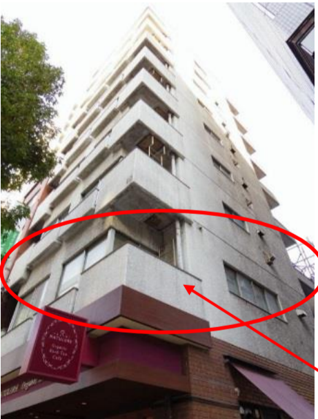
★対象不動産は2Fです。