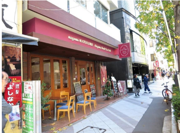
▲1Fはおしゃれなハーブティー専門店です。▲