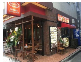
▲1階はダイニングバー (トルコ料理店)