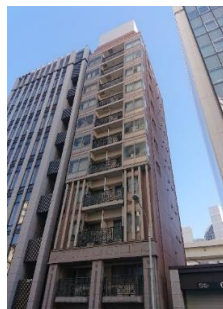
▲建物外観 (タイル貼り)