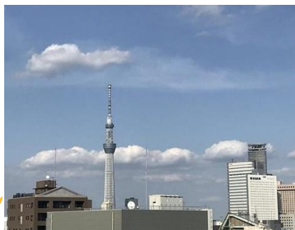
▲サービスルームからの眺望