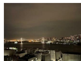
▲レインボーブリッジを望む夜景