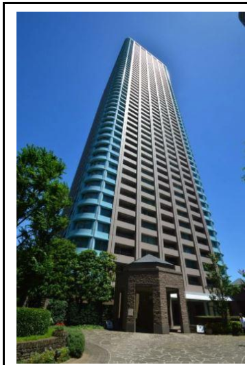
▲建物外観 (54階建、総戸数756戸)