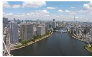
▲眺望 (隅田川を望む)