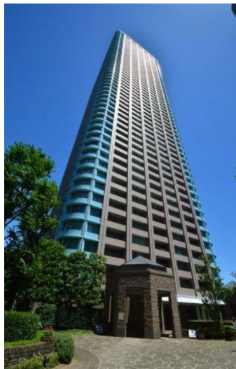
▲建物外観 (54階建、総戸数756戸)