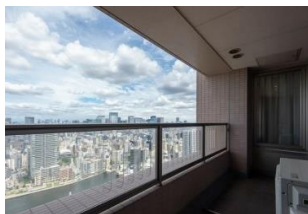
▲バルコニーからの眺望

<リフォーム内容>フローリング貼替・クロス貼替え・建具交換 エアコン4基設置・洗面化粧台交換・洗浄便座付トイレ交換 ユニットバス交換(追焚き機能付・浴室乾燥機付) システムキッチン交換(食洗機付)・ハウスクリーニング etc