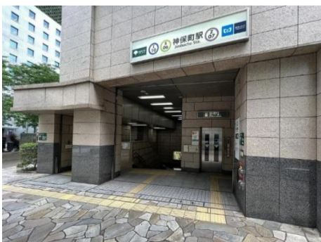
▲「神保町」駅出入口A9直結