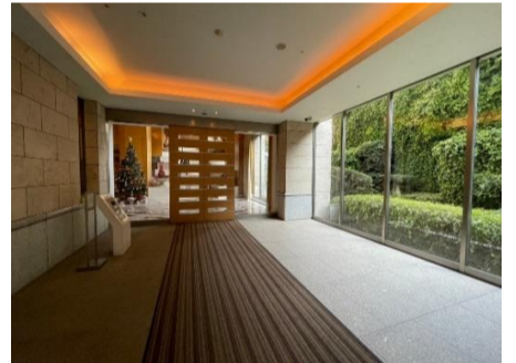
▲Wオートロックシステム