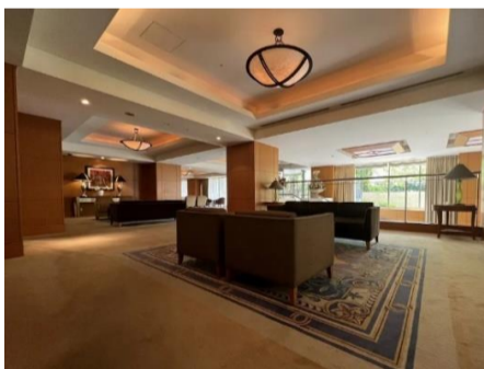
▲ガーデンラウンジ