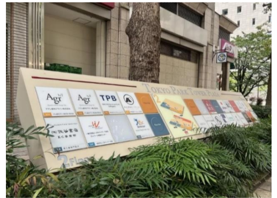
▲1階店舗区画の案内