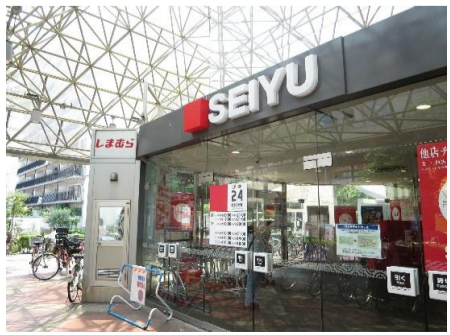
▲スーパー「西友」徒歩2分