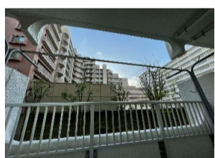
▲バルコニーからの眺望