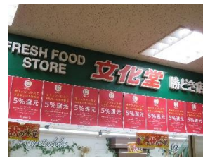
▲スーパー「文化堂」二重サッシ 駅直結 (勝どき駅交差点) (営業時間: AM10:00~PM10:00)