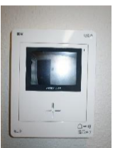
カラーTVモニター付 インターフォン▶