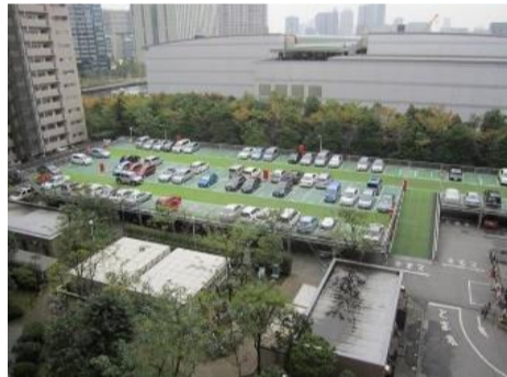
▲敷地内自走式駐車場