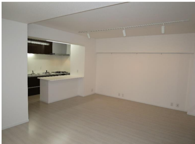
▲ダイニング~キッチン