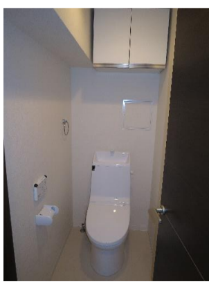
▲シャワー付トイレ