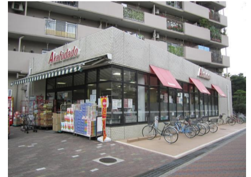
▲1階スーパー「赤札堂」