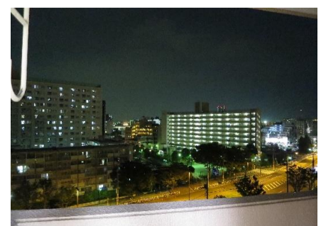
▲バルコニーからの眺望 (夜景)