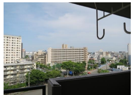
▲バルコニーからの眺望 (昼景)