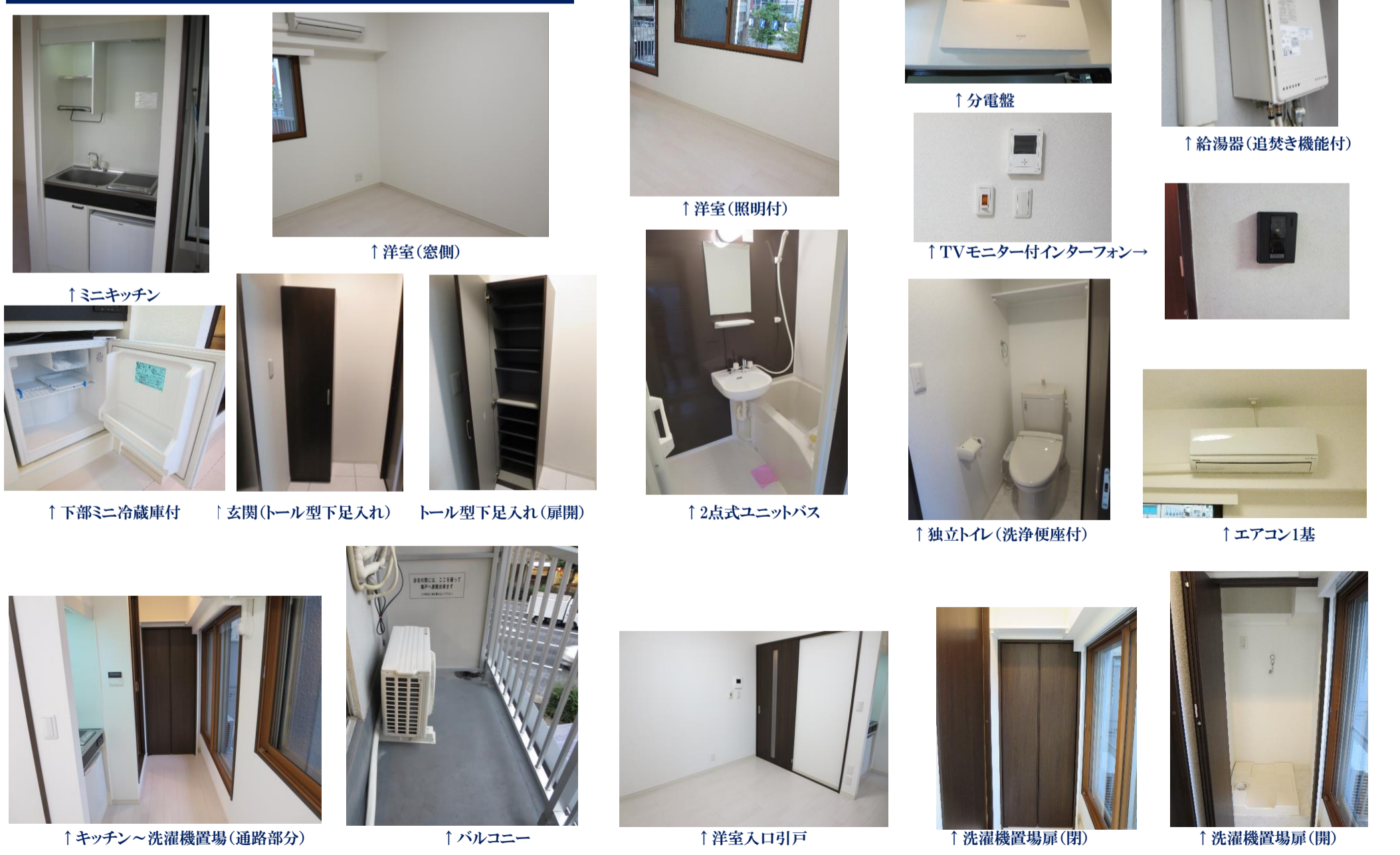
↑ミニキッチン ↑洋室(窓側) ↑洋室(照明付) ↑分電盤 ↑給湯器(追焚き機能付) ↑下部ミニ冷蔵庫付 ↑玄関(トール型下足入れ) トール型下足入れ(扉開) ↑2点式ユニットバス ↑TVモニター付インターフォン→ ↑独立トイレ(洗浄便座付) ↑エアコン1基 ↑キッチン～洗濯機置場(通路部分) ↑バルコニー ↑洋室入口引戸 ↑洗濯機置場扉(閉) ↑洗濯機置場扉(開)