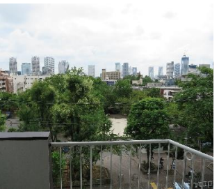
↑バルコニーからの眺望