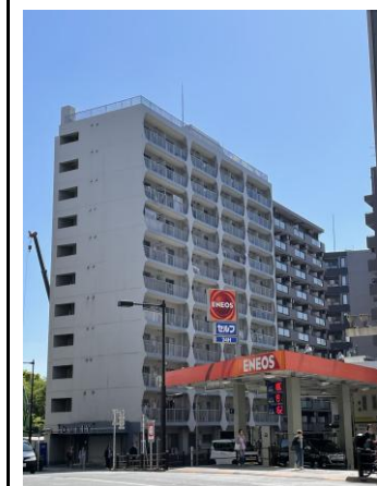
♪スーパーマルエツプチまで徒歩1分